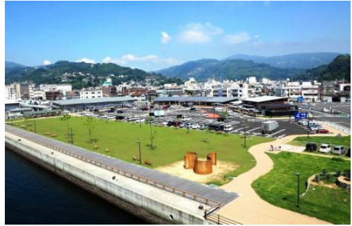
(道の駅・みなとオアシス八幡浜みなっと)