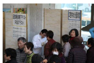
(口腔機能チェック)