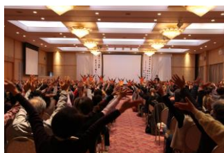
(はつらつ介護予防体操)