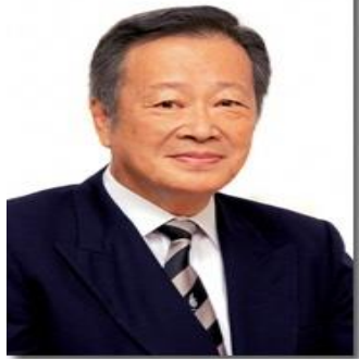
西東京市長 丸山 浩一