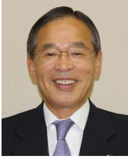
妙高市長 入村 明

妙高市データ ○総面積 445.52 km 2 ○市の花 シラネアオイ ○人口 32,317 人 ○市の木 ブナ ○世帯数 12,411 世帯 ○市の鳥 オオルリ 【特産物】米、日本酒、高原野菜、妙高ゆきエビ、かんずりなど