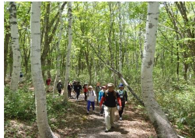
準高地での「気候療法ウォーキング」

また、「食」「雪」「人」などの地域資源を融合させ、市民も来訪者も、すべての人が健康になれる妙高型クアオルト(健康保養地)を目指しています。