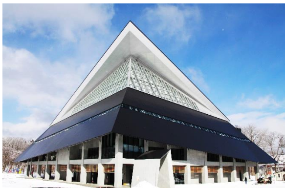
妙高型クアオルトの拠点 「ほっとアリーナ妙高高原」(妙高高原体育館)

今後も、認証の取得を契機に、健康的な旅を楽しみたいかたや、従業員の健康増進を図りたい企業のかた、外国人旅行者などの交流人口を拡大し、全国へ妙高型クアオルトの魅力を発信します。