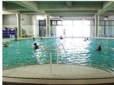
温泉プールでの「水中運動」