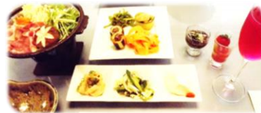
地元食材を使用した ヘルシーメニュー