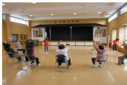
写真1. 高齢者サロンでのストレッチ指導

以上の施策を掲げています。そして、宮古島市独自の体操、「グッバイメタボ体操」や食生活改善推進員の考案メニューを行政チャンネル及び市ホームページにて紹介し、市民の健康づくりを推進している。