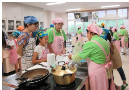
写真2. 小中学校への食育活動