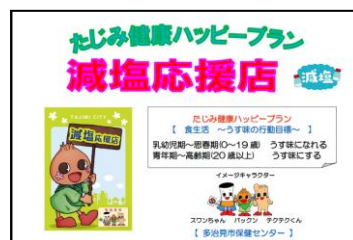
減塩応援店資料表紙

その他、ウォーキング・健康フェスティバルなど様々な地区保健活動の中で、食生活改善推進協議会の協力を得てみそ汁の塩分測定を実施しています。