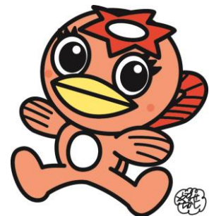
多治見市のマスコットキャラクター うながっぱ

平成24年度に「市民が健康でいきいきと幸せに暮らすことができるまちづくり」を基本理念とした第2次たじみ健康ハッピープランを策定し、地域のソーシャルキャピタルを重視し、行政や医療機関、学校、企業、地域等の関係団体が、相互に連携した健康づくりに関する社会環境の整備を目指しています。また、平成28年度の市民健康調査を踏まえ、後期計画(2019～2024年度)で、「食生活」については、毎食野菜を食べることと薄味の推進、「運動」においては、親子で毎日外遊びをすることや定期的な運動習慣の継続、「喫煙対策」は受動喫煙の機会を減らすことや加熱式タバコの害の周知を重点課題とし、多くの関係機関と協力しながら推進しています。