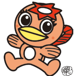
多治見市のマスコットキャラクター

さらに、平成17年7月にWHO健康都市連合メンバーに加盟し、国際基準の健康づくり運動にも積極的に取り組んでいます。