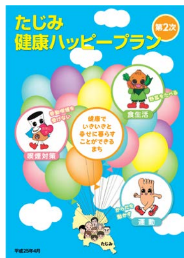
第2次たじみ健康ハッピープラン

第2次プランの大きな特徴として、地域のソーシャルキャピタルを重視し、行政や医療機関、学校、企業、地域等の関係団体が、相互に連携した健康づくりに関する社会環境の整備を目指しています。