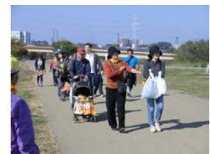
ベビーカーを押しながら

柏市健康文化都市プランの一環として、平成10年度に「手賀沼ふれあいウォーク」が始まりました。このイベントは、子どもから障害者、高齢者などあらゆる世代の人たちが「歩くこと」を通して、テーマである「であい・ふれあい・支えあい」を体感できる内容になっています。また、地域においてもサークルや町会等を中心に身近な地域でのウォーキング活動が活発に実施されています。