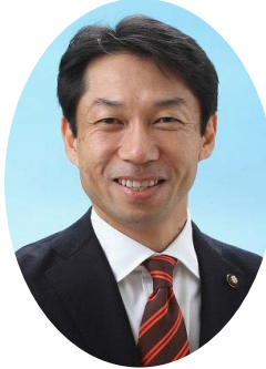
市長 秋山 浩保