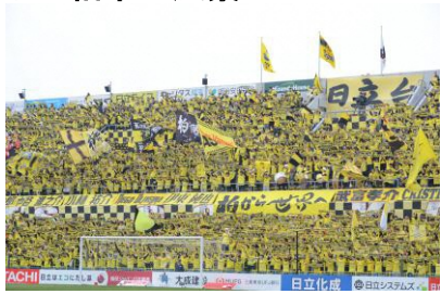
三協フロンテア柏スタジアム