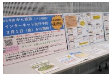
WEB予約システムについて、 パネルを作成して周知