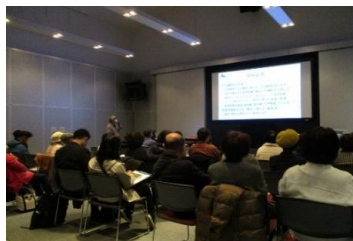
令和5年度「みんなのがん教室@図書館」 がん相談支援センター長の講演

また、がん検診の重要性の周知啓発に加え、検診のWEB予約システムを導入する等、受診率向上にも取り組んでいます。