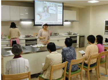
食育セミナー（料理教室）

そして、地域の人々の生活習慣の改善をサポートし、病気予防や健康増進を求める市民の「ここからだの健康」づくりに貢献しています。