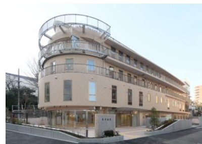
東京療院(港区高輪)

現在、全国11ヶ所の「療院」では、全人的な視点での治療方針を提案し、病気の予防や健康増進を支援する医療を実践しています。具体的には、クリニック部門での西洋医学的な診察に加えて、岡田式健康法（浄化療法、食事法、アートヘルスケア）をはじめ、「運動療法」「園芸療法」「指圧療法」「音楽療法」などを採り入れています。またボランティアと連携して、患者の生活習慣の改善を支援しています。