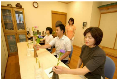
アートヘルスケア (いけばな体験)

療院では、「生活習慣の改善支援」、「治療だけでなく、病気の予防や健康増進の寄与」、「患者の体質、生活環境、生き甲斐などに配慮したQOLの重視」、「有意義な人生を送り、穏やかな死を迎えるための包括的なサポート」、「自然治癒力の尊重」、「医療経済や環境などを配慮」した医療をめざし統合医療のモデルづくりをめざしています。