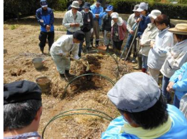
家庭菜園セミナー