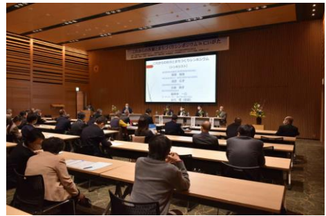
「これからの医療とまちづくりシンポジウム」 (2021.11/14、新潟市)

私たちは、より良いライフスタイルや生き方・人生を求める人々に向けた、①新たな治療スタイルの模索。②生命をみつめ、健康な生活を築き支え合う絆のコミュニティづくり。③環境や心身の健康に直接影響する農業や食、そして芸術などの事業に取り組んでいます。