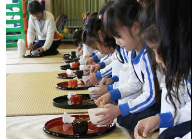
美育活動（茶の湯体験）