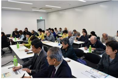
フレイル予防講習