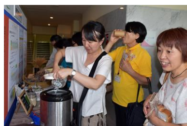
日本支部大会（松戸市）企業展示