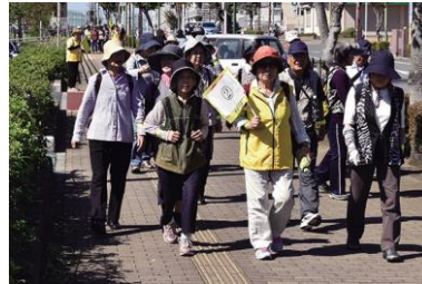
デリシャスウォーキング