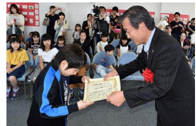
絵手紙コンテスト