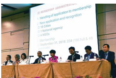
健康都市連合総会（マレーシアクチン市）