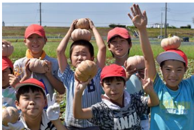
松戸白宇宙かぼちゃの栽培