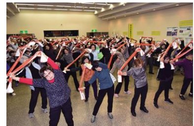
第 2 回健康フェスタ