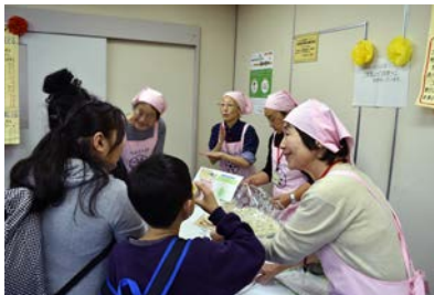
福祉健康フェア (食生活改善コーナー)