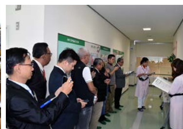
尾張旭市立学校給食センター