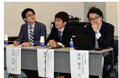
第 3 回（講師：厚生労働省、岡山市）