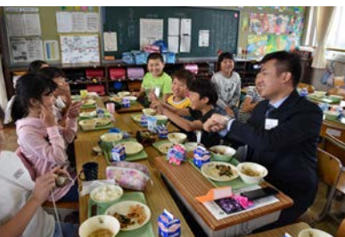
大府市立神田小学校 (給食体験)