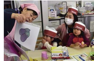
サンドイッチ教室