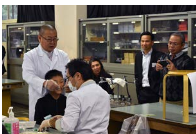
市川市立塩浜学園 (健やか口腔検診)