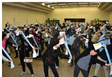
健康フェスタ (タオル体操)