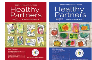
ヘルシーパートナーズ誌