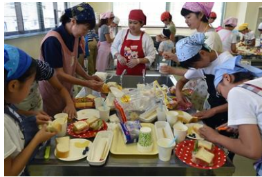
サンドイッチ教室