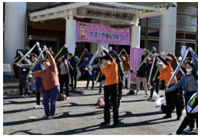
福祉健康フェア (タオル体操)