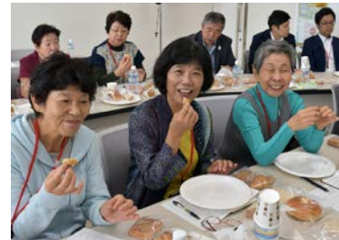
大麦入りパンとスイーツの開発