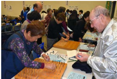
健康フェスタ (ベグ: 手腕技能能力)