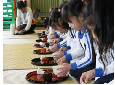
美育活動（茶の湯体験）