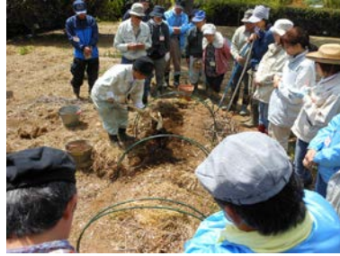
家庭菜園セミナー