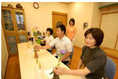
アートヘルスケア (いけばな体験)

現在、全国11ヶ所の「療院」では、全人的な視点での治療方針を提案し、病気の予防や健康増進を支援する医療を実践しています。具体的には、クリニック部門での西洋医学的な診察に加えて、岡田式健康法 (浄化療法、食事法、アートヘルスケア) をはじめ、「運動療法」「園芸療法」「指圧療法」「音楽療法」などを採り入れています。またボランティアと連携して、患者の生活習慣の改善を支援しています。