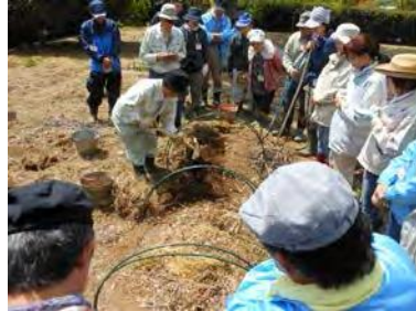
家庭菜園セミナー