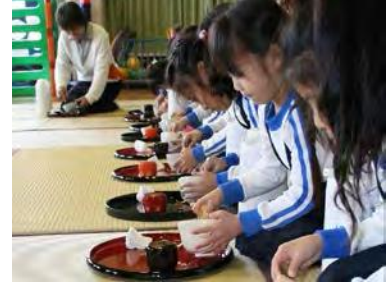
美育活動（茶の湯体験）