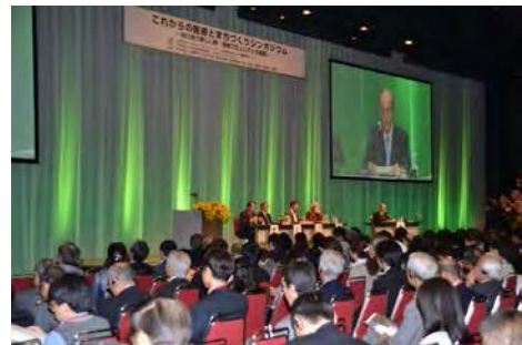
「これからの医療とまちづくり」 国際シンポジウム (2015. 4/25~26、東京・京都)

特に、より良いライフスタイルや生き方、人生を求める人々に向けた、①新たな治療スタイルの模索。②生命をみつめ、健康な生活を築き支え合う絆のコミュニティづくり。③さらに、心身の健康に直接影響する農業や食、そして芸術などの事業に取り組んでいます。