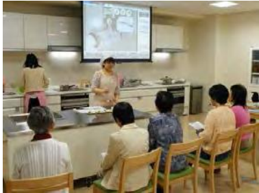
食育セミナー（料理教室）

そして、地域の人々の生活習慣の改善をサポートし、病気予防や健康増進を求める市民の「ここからだの健康」づくりに貢献しています。