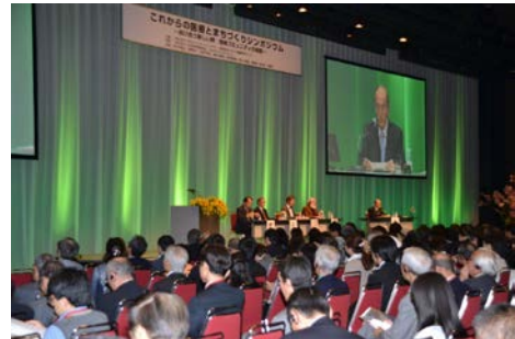
「これからの医療とまちづくり」 国際シンポジウム (2015. 4/25~26、東京・京都)

特に、より良いライフスタイルや生き方、人生を求める人々に向けた、①新たな治療スタイルの模索。②生命をみつめ、健康な生活を築き支え合う絆のコミュニティづくり。③さらに、心身の健康に直接影響する農業や食、そして芸術などの事業に取り組んでいます。