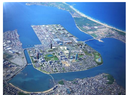
アイランドシティの完成イメージ （※イメージ図は、今後の設計協議等により、変更となることがあります。）

アイランドシティは、平成17年から入居が始まった新しいまちであり、「環境共生」「コミュニティ」「健康」「子ども」をテーマに先進的なまちづくりが行われています。