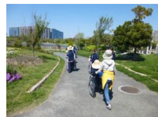
照葉ボランティア