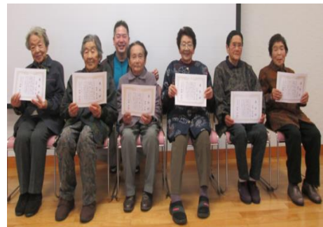
つど 「集い」10 年以上表彰者と 90 歳以上表彰者

毎年恒例となった 100 人で百歳体操では、テーマの通り 100 人そろっていきいき百歳体操を実施しています。