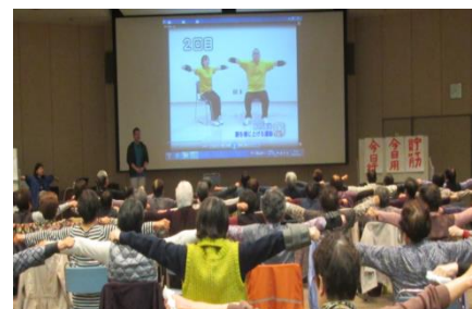
集い交流会の様子100人で いきいき百歳体操

*いきいき百歳体操とは高知県高知市で開発された介護予防を目的とした筋力アップの体操です。