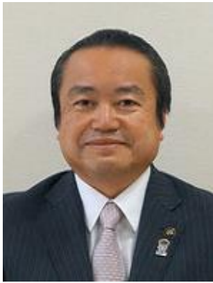
市長 楠瀬 耕作