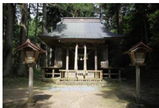
国指定史跡黄金山神社

砂金採り体験ができる「天平ろまん館」の他、奥州三観音の一つ麓岳観音が祭られる「麓峯寺」、日帰り温泉施設「わくや天平の湯」といった観光スポットが点在しています。青ばた豆を使ったおぼろ豆腐やシイタケを使った郷土料理「おぼろ汁」が観光客に好評です。