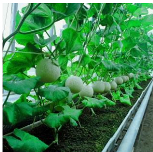
日本一のマスクメロン

袋井市は、静岡県の西部に位置し、全国的にも日照時間が長く、豊かに広がる田園や美しい茶畑、市域を流れる太田川と原野谷川、更には遠州灘など豊かな自然環境に恵まれています。遠州三山(法多山尊永寺、萬松山可睡齋、医王山油山寺)に代表される古刹・名刹もあり、古くは、東海道五十三次のどまん中の「袋井宿」として栄えました。昭和44年の東名高速道路開通後は、米、お茶、温室メロンに代表される農業に加え、工業、商業の集積が進み、農業・商業・工業のバランスがとれた田園型都市として発展を続けています。