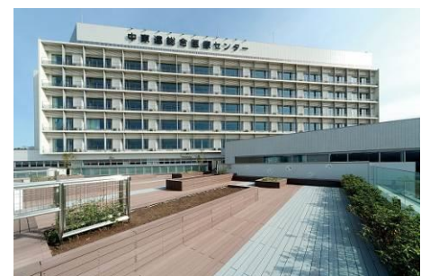
中東遠総合医療センター

この自治体病院の統合による新病院の建設は、全国的な課題である地域医療再生への先駆的な取り組みとしても大いに注目されています。