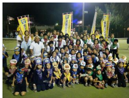
写真3. クイチャー踊り隊活動