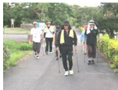
写真1. ノルディックウォーキング活動

宮古島市は、健康アイランド宮古島・スポーツアイランド宮古島・エコアイランド宮古島の3テーマへの取り組みにより、健康都市の構築へ歩んでいます。