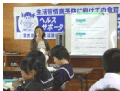
写真2. 小・中学校への食育活動