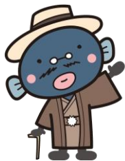
我孫子市マスコットキャラクター 手賀沼のうなぎちゃん

我孫子市では、平成26年度から「誰もが、いつでも、どこでも取り組める」健康づくりを推進するための「健康に関する動画配信」を開始、産後2か月未満の母子に対して母体のケア・乳児ケア・育児相談など心身のケアや育児サポート等の支援を行う産後ケアを充実、平成25年度から市内保育園・幼稚園で実施しているフッ素洗口事業を平成28年度は小学校にも展開していきます。今後も、全庁をあげて市民が健康にいきいきと生活できるまちづくりを推進していきます。