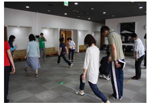
こうべ歩KING歩 QUEEN 決定戦！ キックオフイベントの様子

運動不足になっている働く世代の人たちが、職場でチームをつくり、メンバー全員が歩数計を持ち、実施期間中にメンバー全員の歩いた平均歩数を競うものです。健康づくりと病気予防を可能とする「歩き方(量と質のバランス)」を、ゲーム感覚で楽しく体感し、チームで競い、運動習慣をつけ、生活習慣病等の予防に主体的に取り組むことを目指します。