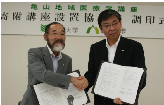
三重大学との寄附講座設置協定書調印式 写真左は三重大学学長（平成23年5月当時）

この講座では、亀山市立医療センターを主なフィールドとして、市民が健康で安心できる生活を提供する最適な医療保健体制の確立に向けて、研究・教育活動が行われています。