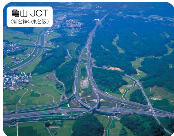
亀山 JCT (新名神⇄東名阪)