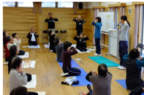
「健康づくり応援隊養成講座」で体操の仕方学ぶ地域の皆さん

その取り組みの一つとして、地域での健康づくり活動の定着に向けた「健康づくり応援隊養成講座」を開催し、地域での健康づくり活動の輪を広げています。