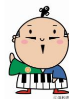
出世大名 家康くん

また、ゆるきゃら®グランプリ 2015において、出世大名家康くんが念願のグランプリを獲得し、平成29年の大河ドラマは、浜松を舞台とする「おんな城主直虎」が放映されるなど、創造性あふれる地域です。