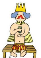
八幡浜ちゃんぼん PRキャラクター 「はまぼん」