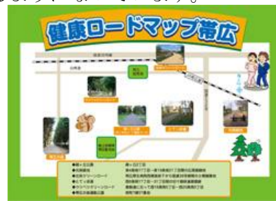
健康ロードマップ 検索