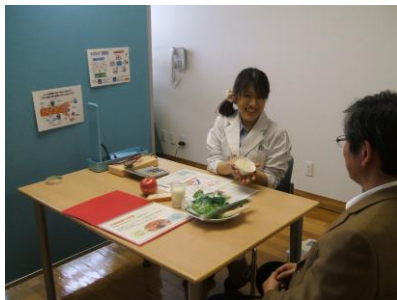
栄養士による講話

帯広市では、「第二期けんこう帯広21」の重点施策として「糖尿病対策」「がん対策」「こころの健康」を掲げています。健康づくり事業では、食生活などの生活習慣・体組成（体重・体脂肪率・筋肉量など）・ストレス度の測定を行い、個別の結果帳票をもとに保健師、栄養士、健康運動指導士が3～6ヶ月間継続して支援しています。特に働き盛りの世代の健診データの改善や重症化予防に力を入れていきます。