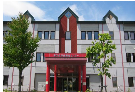
保健福祉センター

平成25年4月にはスマートライフプロジェクトに登録し、職員全員が健康づくりに取り組んでいます。