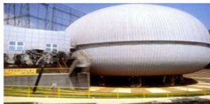
多摩六都科学館（西東京市芝久保町）