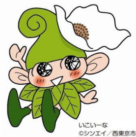
いこいな