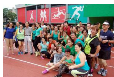
マリキナスポーツセンターでの交流