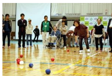
「ボッチャ」競技大会