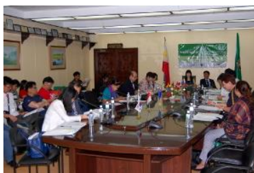
健康都市連合理事会