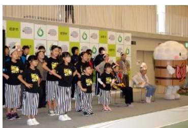
健康体操のイベント