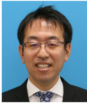
市長 日永 貴章