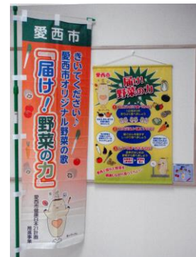
のぼり旗、タペストリー、CDの写真です