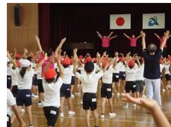
小学校の体育館で あいさいのびのびストレッチの 講習会をしています