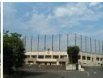
ファーストタウン鎌ヶ谷