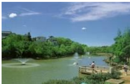
市民の憩いの場 貝柄山公園