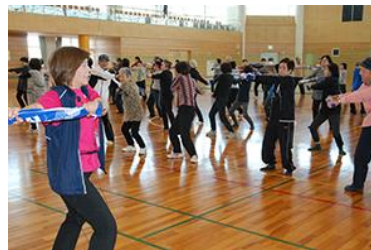
デリシャスウォーキング