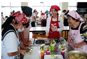
サンドイッチ教室