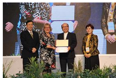
授賞式（健康都市パイオニア賞）