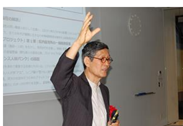
尾身茂氏による基調講演