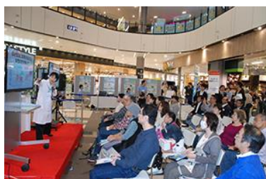
健康セミナー会場

イオンモール幕張新都心グランドモールにて、ロコモ予防のイベントを花王株式会社の特別協力のもと開催しました。