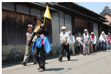
健康ウォーキング

北名古屋市をモデル都市として、「健康ウォーキング」、「サンドイッチ教室」、「デリシャスウォーキング」のイベントと活動を、ウォーキング推進員、生活改善推進員、健康づくり推進員の皆さんと協同しました。