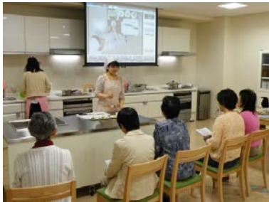
食育セミナー（料理教室）

そして、地域の人々の生活習慣の改善をサポートし、病気予防や健康増進を求める市民の「ここからだの健康」づくりに貢献しています。