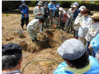
家庭菜園セミナー