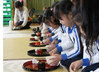
美育活動（茶の湯体験）