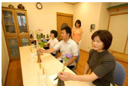
アートヘルスケア (いけばな体験)

療院では、「生活習慣の改善支援」、「治療だけでなく、病気の予防や健康増進の寄与」、「患者の体質、生活環境、生き甲斐などに配慮したQOLの重視」、「有意義な人生を送り、穏やかな死を迎えるための包括的なサポート」、「自然治癒力の尊重」、「医療経済や環境などを配慮」した医療をめざし努力を積み上げています。