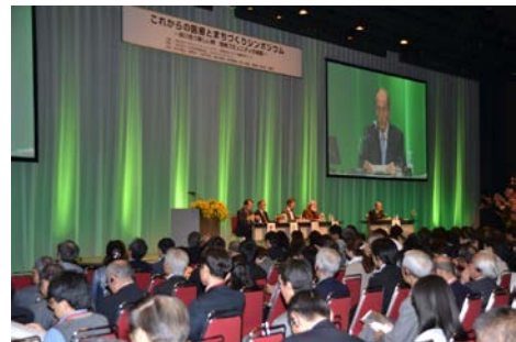
「これからの医療とまちづくり」 国際シンポジウム (2015. 4/25~26、東京・京都)

特に、より良いライフスタイルや生き方、人生を求める人々に向けた、①新たな治療スタイルの模索。②生命をみつめ、健康な生活を築き支え合う絆のコミュニティづくり。③さらに、心身の健康に直接影響する農業や食、そして芸術などの事業に取り組んでいます。