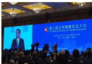
WHO 第 9 回ヘルスプロモーション国際会議開会式 分科会での発表の模様 (中国・上海)