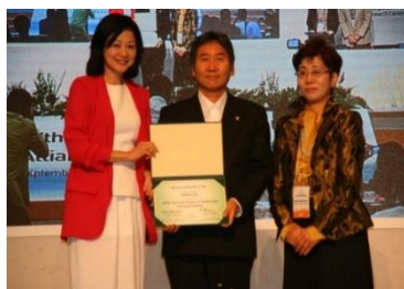
健康都市連合国際大会 (韓国・原州)

さらに、平成 28 年 11 月に WHO(世界保健機関)が中国・上海で開催した WHO 第 9 回ヘルスプロモーション国際会議に招待され、日本からの首長としては唯一参加。「健康都市国際市長フォーラム」分科会で「健康都市やまと」の取り組みを発表しました。